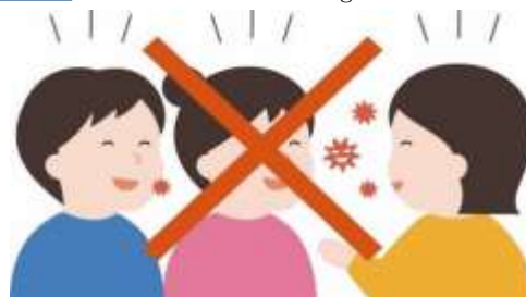
Conversar o emitir la voz muy cerca de las otras personas.