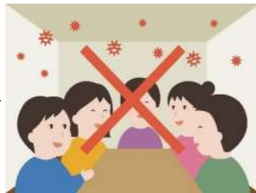
Ambiente cerrado y mal ventilado.